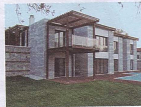
Defne Evi, M artı D Mimarlık.