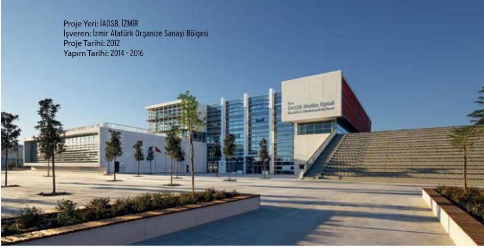
Proje Yeri: İAOSB, İZMİR İşveren: İzmir Atatürk Organize Sanayi Bölgesi Proje Tarihi: 2012 Yapım Tarihi: 2014 - 2016

Akademik ortamlarda stüdyo dersleri de bir soruna çözüm arayışı pratiklerinin yapıldığı bir ortam. Aslında çok boyutlu bir tartışma, fikir geliştirme ortamı. Farklı alanlarda deneyime sahip kişilerin bu ortam içinde bulunması stüdyo ortamını zenginleştiriyor diye düşünüyorum. Mimarlık kolektif bir üretim. Stüdyolar da bu üretimin deneyimlendiği ortamlar.