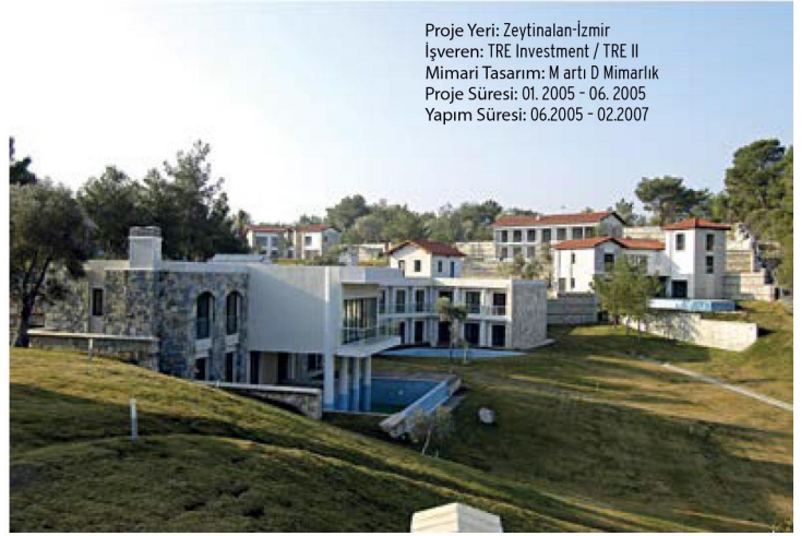
Proje Yeri: Zeytinlan-Izmir İşveren: TRE Investment / TRE II Mimari Tasarım: M artı D Mimarlık Proje Süresi: 01.2005 - 06. 2005 Yapım Süresi: 06.2005 - 02.2007

amacıyla yapılmış İzmir-Aydın tren hattının bulunduğu alan, ancak günümüzde işlevini yitirmiş. Ayrıca bu güzergah konum itibarı ile kent merkezini bölüyor, engel oluşturuyor. Şekil.2 Kentsel bağlantı açısından başka engellerde var bu alanda, örneğin transit araç geçişleri, metro hattı, doğal bariyer olarak Meles çayı ve liman. Liman biliyorsunuz İzmir için çok önemli, ticaret kenti olmasının en önemli sebeplerinden biri liman. Ancak bugün konumu itibarı ile çok tartışılıyor. Büyük gemilerin buraya giremediği söyleniyor, genişleme alanı olmayan bir yer liman. Ben bu tren yolunun üst kote alınması, bu limanın uygun bir yere taşınması ve bu yolların gerekirse yeraltına alınmasıyla bu bölgede bu fuar için gerekli alanın yaratılabileceğini düşünüyorum. Ben olsam burada bunu yapardım diye düşünüyorum. Tabii bu alanın tamamı kamuya ait değil. Kamulaştırılabilir veya kiralanabilir diye düşünüyorum.